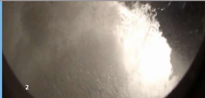
1 / 2 komprimiertes CO 2 in einem Autoklave.